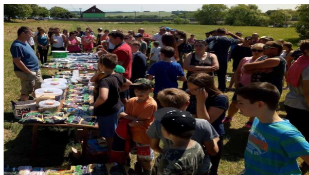
Pretek mládeže vo VN Svinica - 13.5.2018